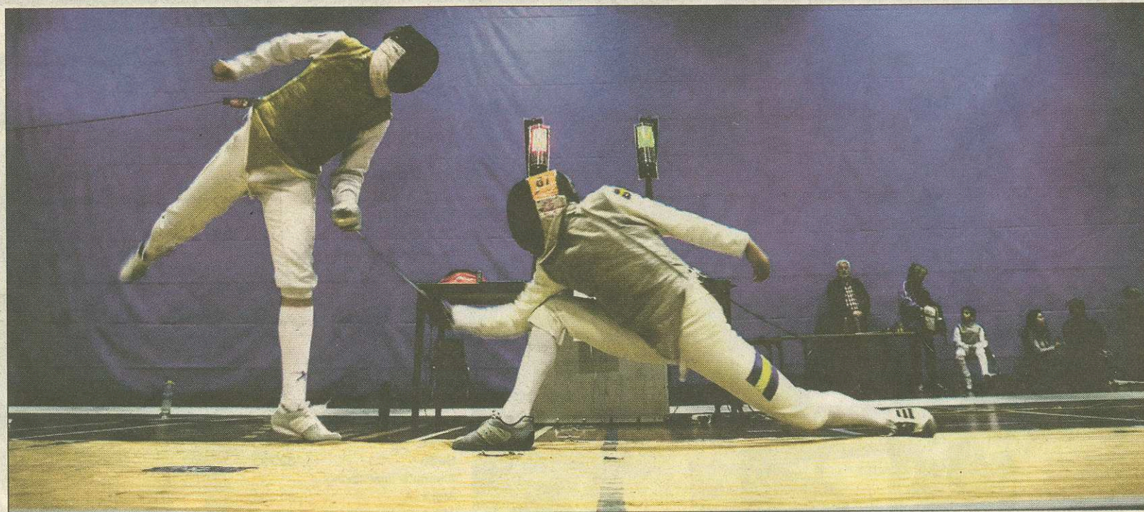
Fægteklubben Trekanten er Nordens største fægteklub - og arrangerer også Nordens største fægtstævne

Og det var der til dette store fægtstævne, der havde deltagelse af hele 300 fægtere, der kom fra Danmark,