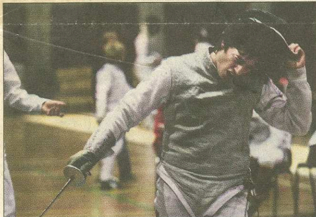
Mere end 300 fægtere fra hele verden deltog i Østerbro-klubbens store stævne